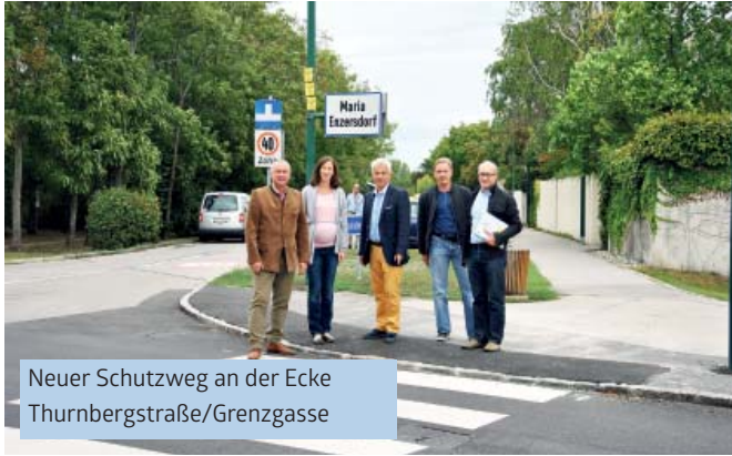
Neuer Schutzweg an der Ecke Thurnbergstraße/Grenzgasse