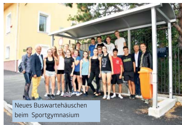
Neues Buswartehäuschen beim Sportgymnasium