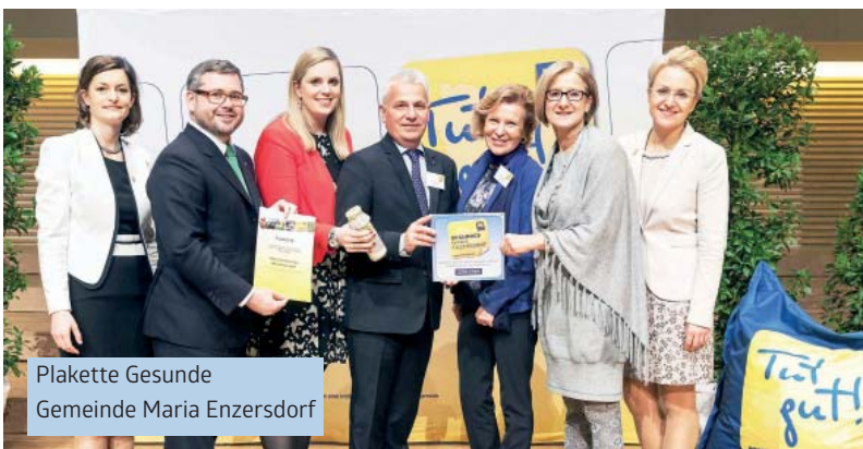
Plakette Gesunde Gemeinde Maria Enzersdorf