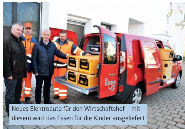
Neues Elektroauto für den Wirtschaftshof – mit diesem wird das Essen für die Kinder ausgeliefert