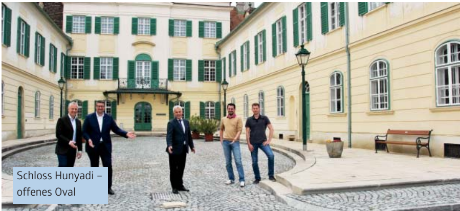
Schloss Hunyadi – offenes Oval