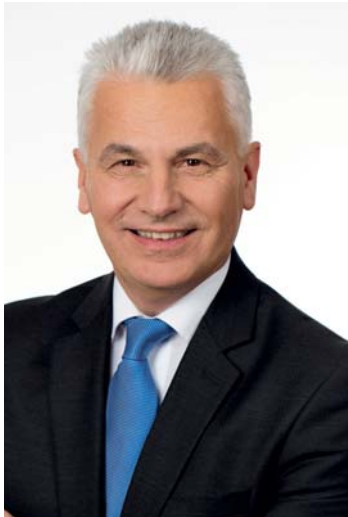
Bürgermeister Johann Zeiner