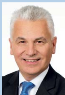
Bürgermeister Johann Zeiner