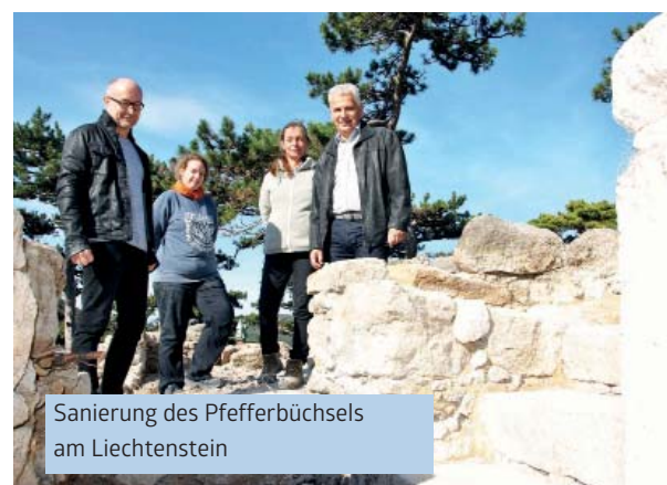
Sanierung des Pfefferbüchsels am Liechtenstein