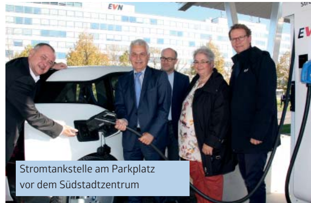
Stromtankstelle am Parkplatz vor dem Südstadtzentrum