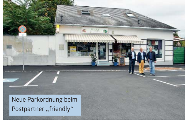
Neue Parkordnung beim Postpartner „friendly“