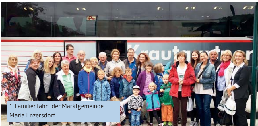
1. Familienfahrt der Marktgemeinde Maria Enzersdorf