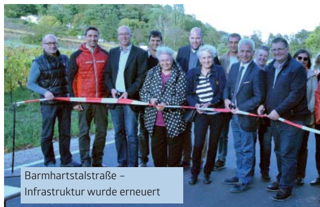
Barmhartstalstraße – Infrastruktur wurde erneuert