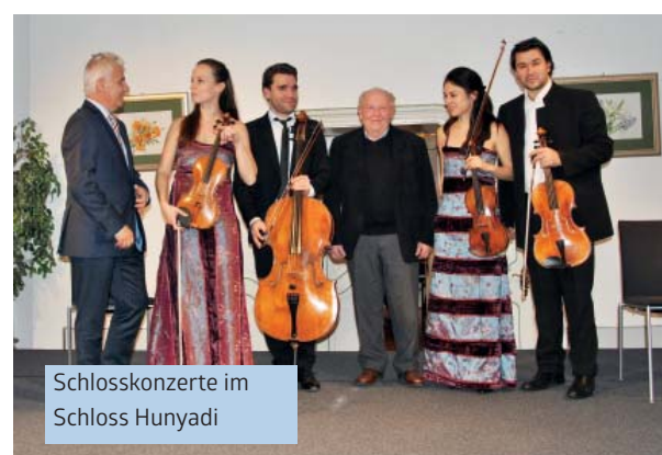
Schlosskonzerte im Schloss Hunyadi