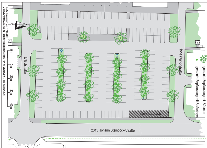
Strukturplan Bepflanzung Parkplatz Südstadt.