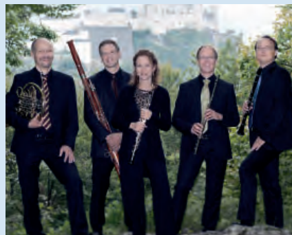
1. Juli 2021 VENTUS QUINTETT Werke von Haydn, Françaix, Dvořák, Miranda, Bizet