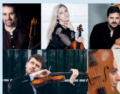
8. Juli 2021 STREICHQUARTETT WIENER KAMMERSYMPHONIE Werke von Mozart, Brahms, Haydn, Korngold