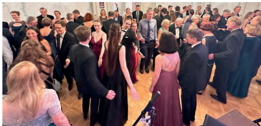
Nach der Tombola wurde Quadrille getanzt.