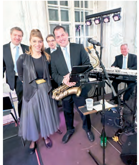
Die Band Topsound sorgte für die perfekte musikalische Tanzmusik beim Bürgerball.