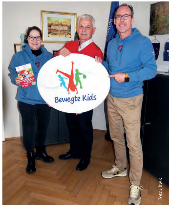
Bürgermeister Johann Zeiner freut sich über das sportliche Angebot für die Sommerferien 2024.

Weitere Infos bzw. Möglichkeit zur Anmeldung finden Sie hier: https://holdhausnord.at/bewegte-kids-suedstadt/