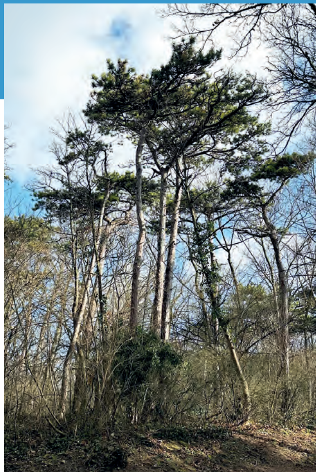
So sieht eine gesunde Baumgruppe am Liechtenstein aus. Die Schwarz- und Schirmföhren werden jedoch ob der Klimabedingungen weniger, Esche und Ahorn wachsen hingegen gut.