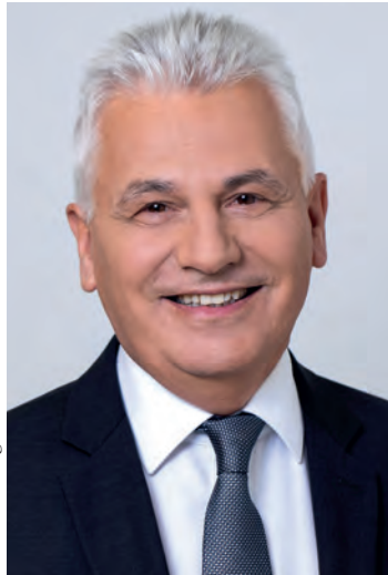
Bürgermeister Johann Zeiner