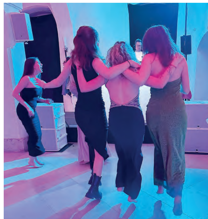
Ausgelassene Stimmung in der Disco im Säulensaal.