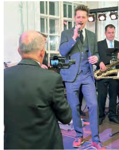
Mitternachtseinlage mit Musical-Star Lukas Perman.